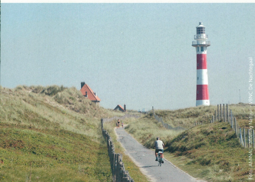
Vlaams natuurreserveaat "De IJzermonding" te Nieuwpoort

Marc Geens • stafmedewerker milieu- en natuurbeleid, WES